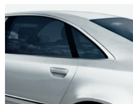
Royal Bond Serie